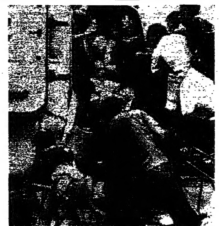
مشرات من الفيتناميين الجنوبيين يحاولون ركوب طائرة « هليكوبتر » للهرب من مدينة « نها ترانغ »

مباردات ديبلوماسية لبريكية جديدة كان قد اعلن عنها قبل ساعات وروثاند تيسين احدثت باسم الرئيس نورد . وتراجع تيسين موضحا ان الولايات المتحدة لجأت الى الطرق الديبلوماسية للتعاطي للضغط على دول اخرى لكي تحاول اتمام فيتنام الشمالية بوضع حد لهجومها العسكري . واكد السكرتير الصحفي للبيت الابيض ان اعضاء في مجلس الأمن القومي ابله اثناء فير صحيفة « سايفون » واشنطن - ر - ا ب ، يدب ، وصرف